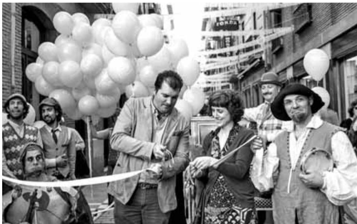
El momento de la inauguración de la Calle en Rosa de Pamplona.