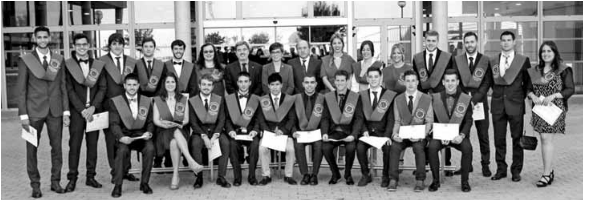
Los estudiantes, posando durante el acto.